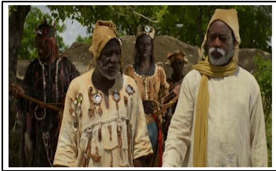
Les chasseurs dans le film Soleils

La distinction des costumes sacrés se fonde sur ces critères sus dégagés à partir des costumes recréés dans des films burkinabè. En dehors du cinquième critère, les quatre autres sont fondamentaux et indispensables dans la sacralité d'un costume. Au regard de cette critérisation du costume sacré, le profane ne peut donc l'endosser. Cependant, il est accessible à tous ceux qui sont disposés à l'initiation. Et comme l'a dit Y. Dakouo (2017), il peut être maîtrisé par qui le veut, pourvu que les conditions soient réunies.